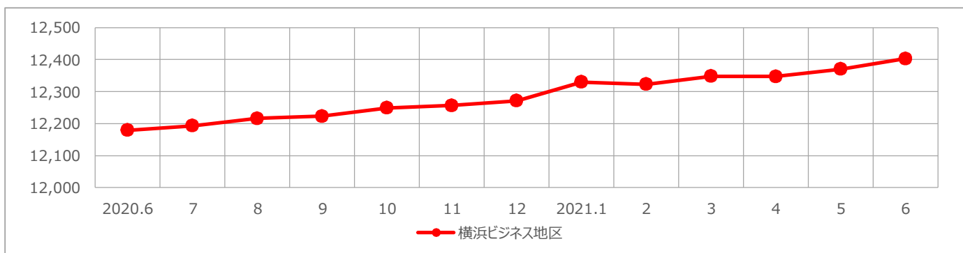
【横浜ビジネス地区／平均賃料の推移】

● 横浜ビジネス地区の6月時点の平均賃料は12,403円、前月比0.27% (33円) 上げました。