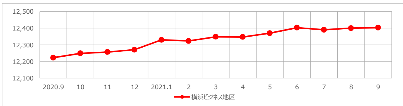
【横浜ビジネス地区／平均賃料の推移】

● 横浜ビジネス地区の9月時点の平均賃料は12,403円、前月比0.02% (3円) 上げました。